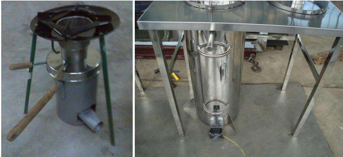
Картина 2: Два зразки газифікаційних плиток – на них готують так само, як на газовій плиті. Потужність великої, з нержавіючої сталі, можна регулювати маленьким вентилятором

Великий потенціал мають маленькі газифікаційні установки, котрі в першу чергу служать для приготування їжі, зокрема в країнах, які розвиваються. У таких країнах буває витрата палива для приготування їжі (напр. на трьох каменях) дуже значною через малий ефект використаних процесів разом з великою продукцією отруйних речовин (будинки заражені димом, який спричиняє очні та легеневі захворювання). Більш дотепна технологія може знизити витрату палива та продукцію шкідливих речовин, а крім того ще надати краще добриво, ніж простий попіл. Для готування або опалення можливо використовувати ще й таку біомасу, котру за нормальних умов застосувати неможливо.