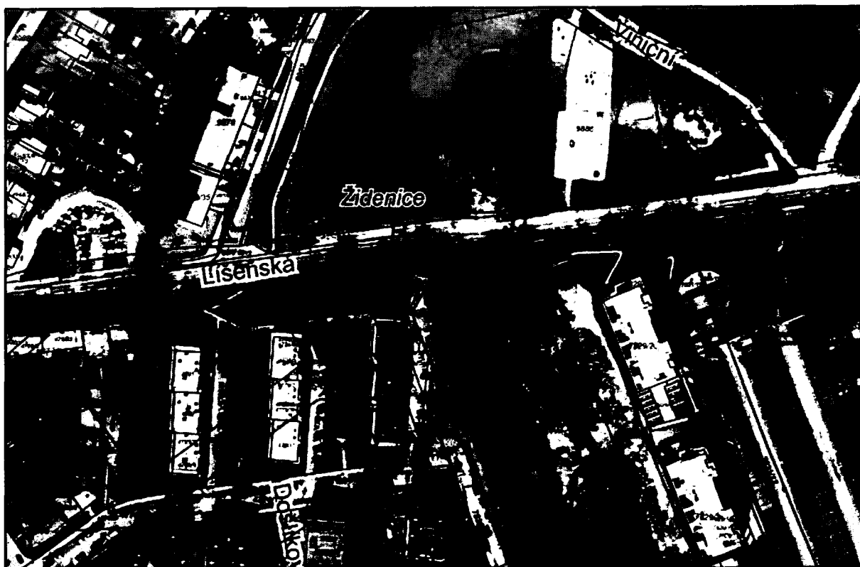
k.ú. Židenice, p.č. 7822/1/22/23, p.č. 7831/10