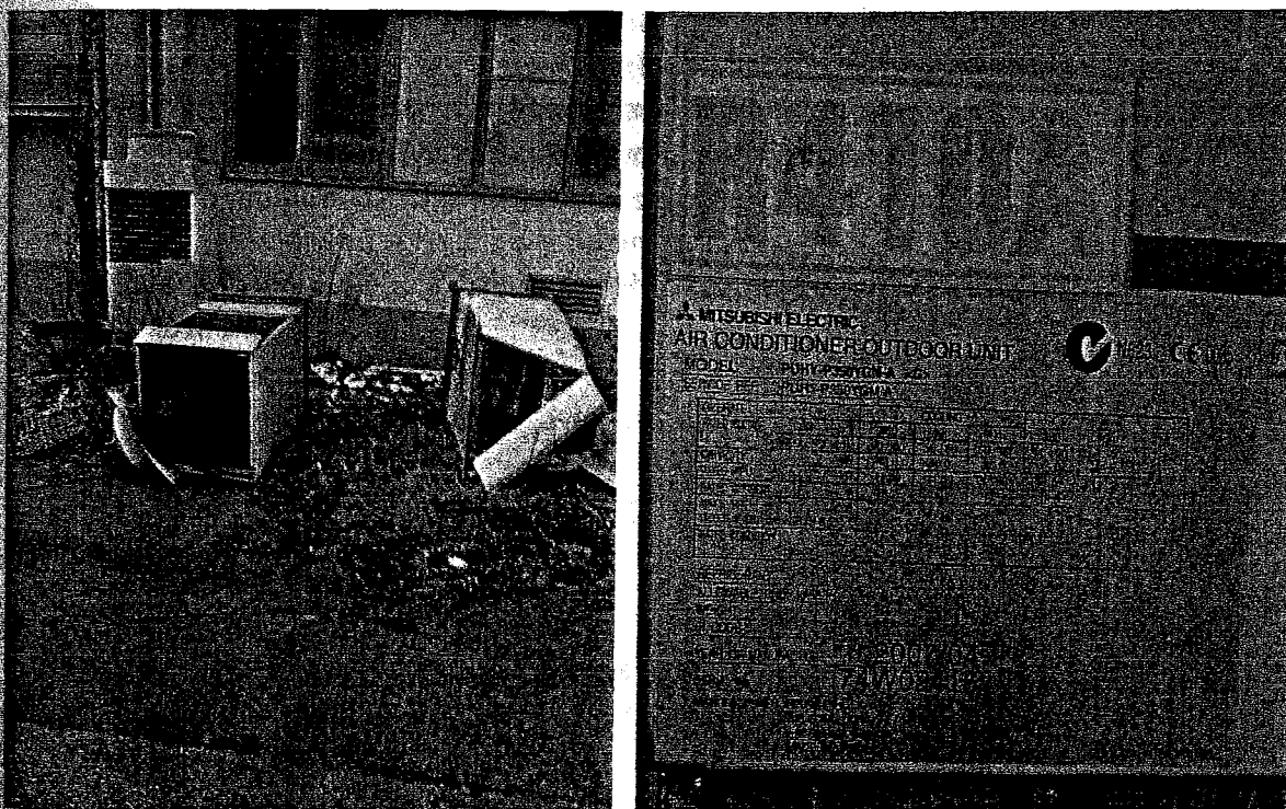
Obr. B.1 Ukázka umístění venkovních jednotek ve vnitřním dvorním traktu objektu Masná 3c, Brno

Předmětné systémy klimatizace jsou tvořeny třemi nezávislými systémy přímého chlazení typu VRF, které zajišťují klimatizaci pěti podlaží objektu Masná 3c. Dohromady se v objektu nachází 44 vnitřních jednotek těchto systémů. V roce 2014 došlo k poškození dvou ze tří venkovních (kondenzačních) jednotek. Jedná se o venkovní jednotky typu PUHY P 350 YGM – A s chladícím výkonem 40kW a topným výkonem 45 kW. Tyto jsou nezbytnou součástí chladících okruhů. Jedna poškozená jednotka je zcela znehodnocena (byly odstraněny zásadní prvky chladících okruhů - kompresor, akumulátory chladiva, výměník, elektronické součásti), druhá jednotka byla poškozena odtržením chladivových potrubí, zprohýbáním nosných prvků konstrukce, technický stav vnitřních dílů je nezjištěn. Jednotku nelze osadit zpět do chladícího okruhu a to z důvodu možného a velmi pravděpodobného kontaminování systému nečistotami, může dojít k totálnímu znehodnocení celého systému a to nejen potrubních rozvodů chladiva, ale i vnitřních klimatizačních jednotek.