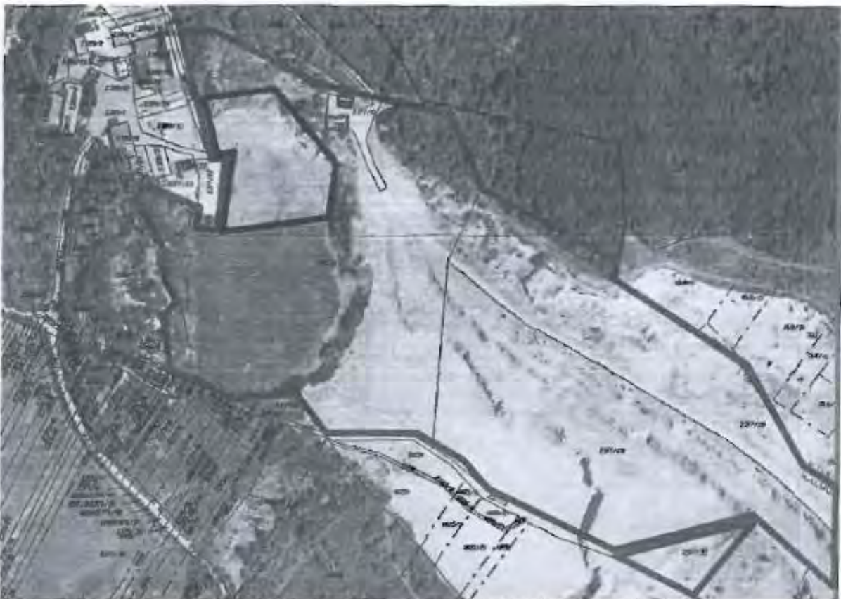
Cervený polygon – pozemky v majetku ZO ČSOP Pozemkový spolek Hády na území města Brna Černý polygon – plocha požadované změny na kategorii Plocha lehké výroby - E

Vymezte v lokalitě lomu Hády plochu E místo plochy K v k.ú. Maloměřice při ul. Hády v návaznosti na stávající areál E/v2 vymezený dle var. II v rozsahu dle graf. přílohy námítky, upravte rozsah režimu ÚSES.