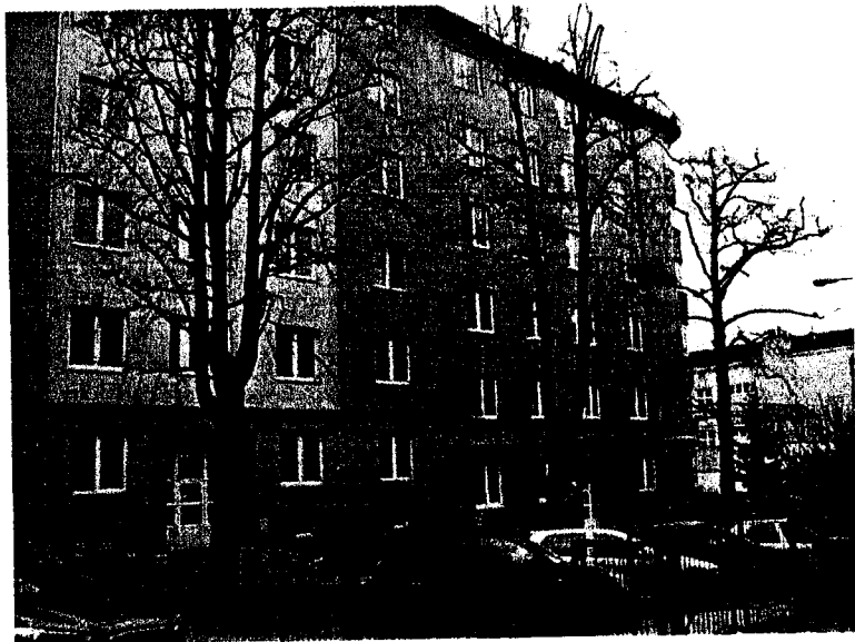
Celkový pohled uliční