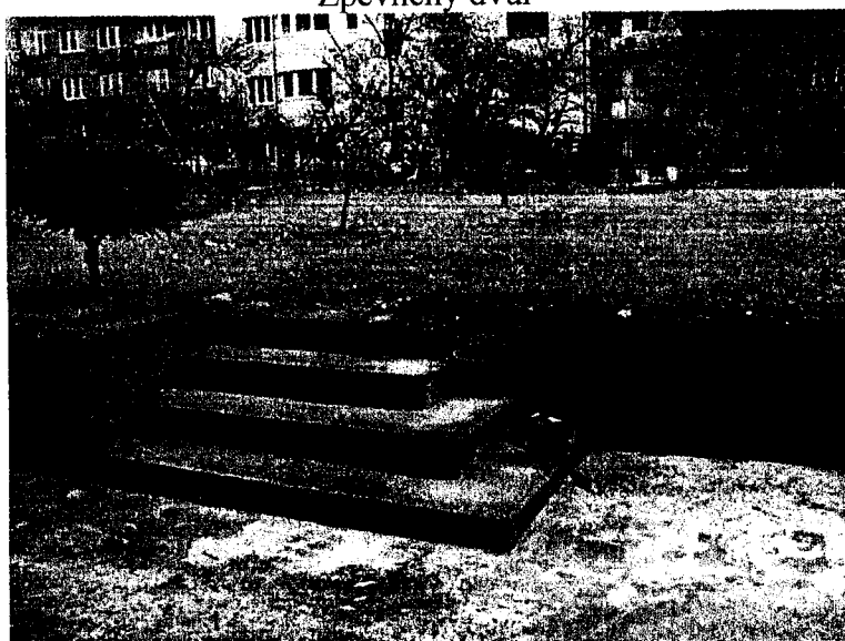
Dvorní část-schodiště na zahradu