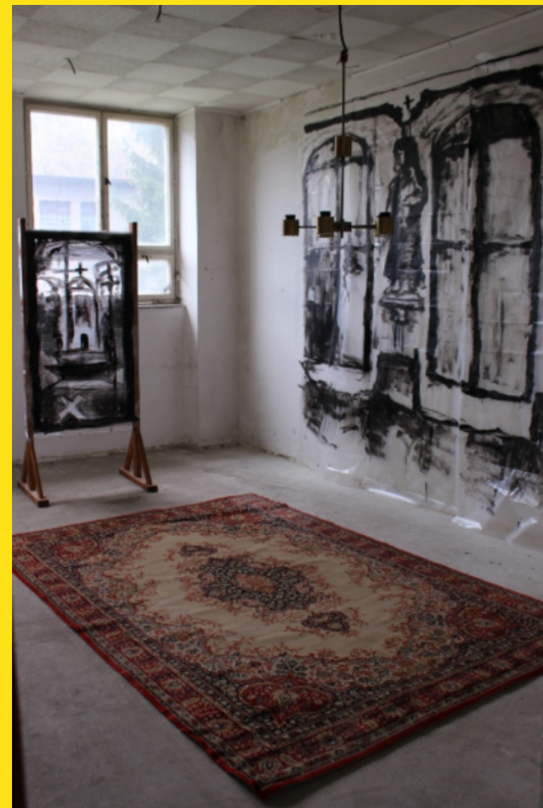
Kancelářská kaple, Projek Program, 2016 Instalace (5 x 3 m): kresba, objekty, koberec