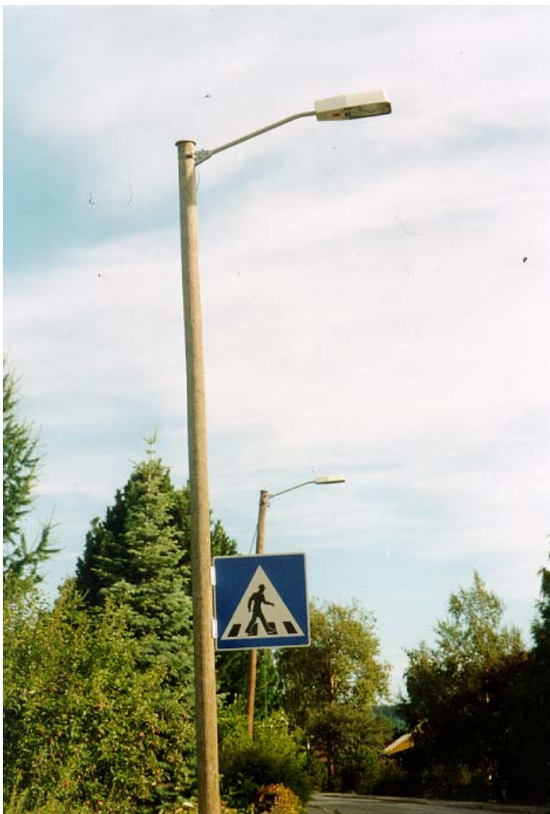
Původně plně cloněná svítidla na dřevěných sloupech na stráni nad Lillehammerem. Svahové pohyby je během let poněkud naklonily...

U všech upevnění svítidel je nezbytné dbát na to, aby byla namontována přesně vodorovně (či u dlouhých svažitých pozemků skloněna podél terénu) a nesvítila jinam než dolů. U starých stožárů s výložníky, které míří šikmo vzhůru, to může být problém – je pak nutné volit buď svítidlo, které lze i tehdy namontovat vodorovně, nebo použít mezikus, který to umožní.