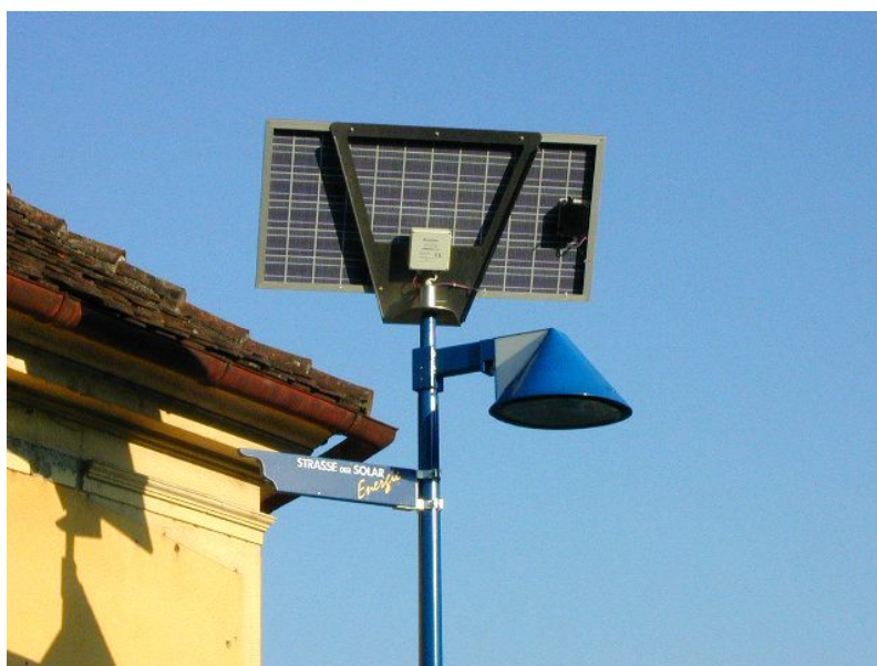
Svítidlo na ulici Sluneční energie v Gleisdorfu ve Štýrsku

V některých případech může být místo pokládání kabeláže výhodné použít svítidla zcela autonomní, ovládaná buď ručním programováním (když jich je jen málo) nebo radiově. Drahým prvkem s nevelkou trvanlivostí jsou u nich akumulátory, neomezenou trvanlivost může mít fotovoltaická část, totiž solární články. Solárně napájená samostatná svítidla je logické volit slabá a co nejkratší dobu s nimi svítit naplno – tak mohou být články i akumulátory nevelké. Nízkotlaké sodíkové výbojky v kombinaci s ještě slabšími zářivkami jsou zde nejvhodnější volbou. Má-li být osvětlení po dobu šesti hodin zajištěno i za zamračených krátkých dní, může být výhodnější kabel přece jen položit, stačí ale nízkonapěťový, umožňující nouzové dobíjení akumulátorů v zimě a odběr velkých přebytků v létě. Stejným kabelem lze pak soustavu i ovládat.