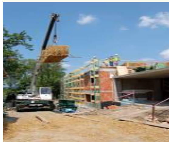
pokládání dvou vrstev slámy na střechu (vrstvy se oddělují papírem):