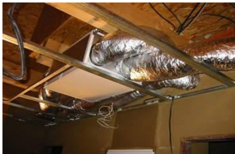
oba velké předavače tepla do větracích jednotek: