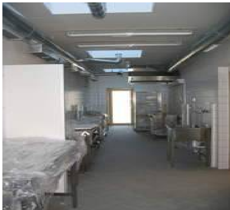
ucpaná výustka větrání (možná nedostatečná):