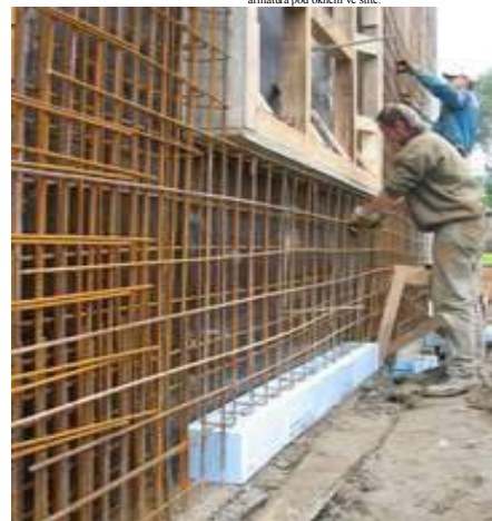
armatura pod oknem ve štítě: